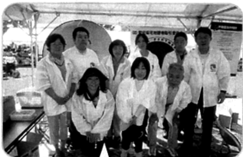
笑顔でお疲れさま