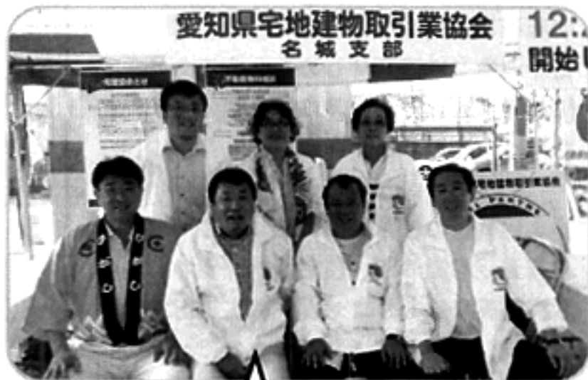
大盛況に終わりました