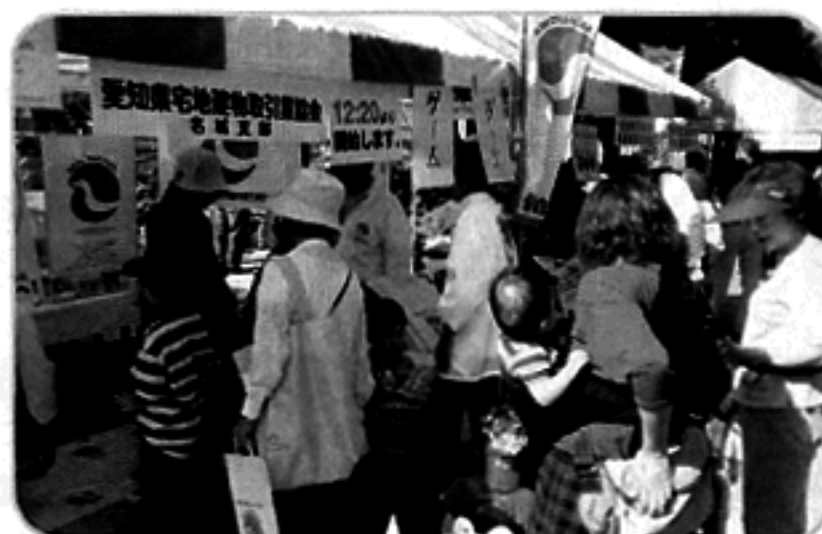
お子様連れで、賑わってます!